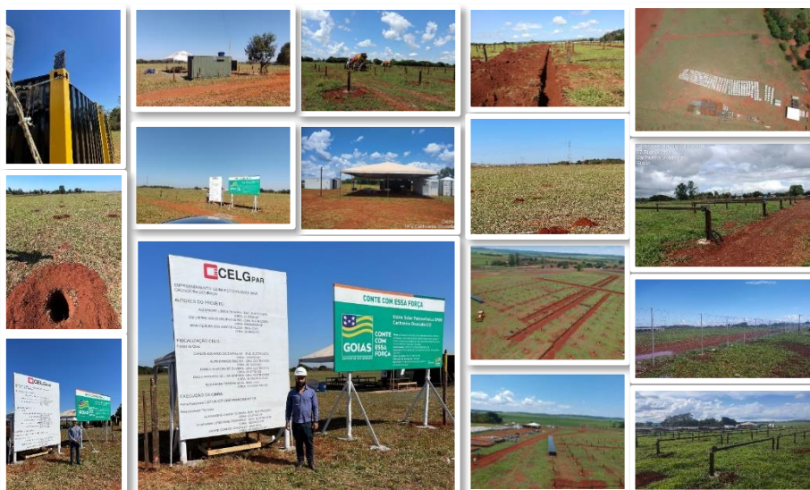
Início das obras da UFV Cachoeira Dourada

A fonte das receitas da empresa é lastreada na geração de energia e na receita decorrente de dividendos de investimentos em Sociedades de Propósito Específico. Inclui-se ainda a exploração da geração de energia fotovoltaica como produto no qual a empresa coloca sua força e seu empenho.